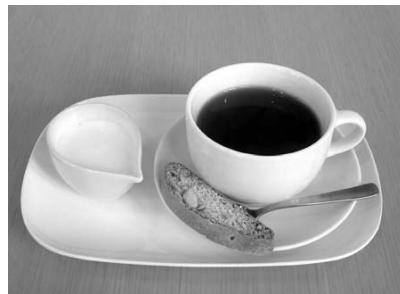
秋冬限定新メニュー / ミルクティ（ビスコッティ付き）300円

尚、11月から営業時間が変更（火曜日～日曜日の11:30～17:00）となり、月曜日は休業となりました。どうぞよろしくお願い致します。