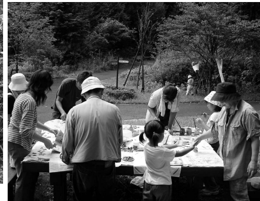
ネイチャー・アート (9月11日)