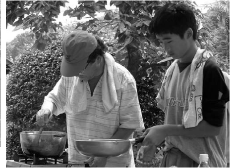
スローフード・クッキング (8月3日)