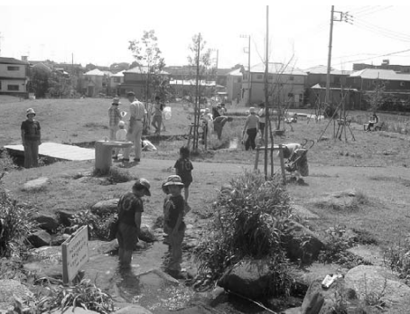
昆虫たちの不思議発見 (9月12日)