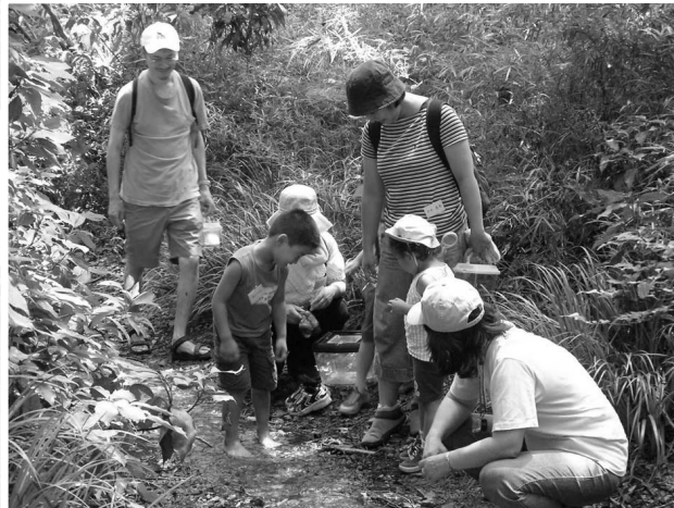
親子で自然の中へでかけよう (7月25日)