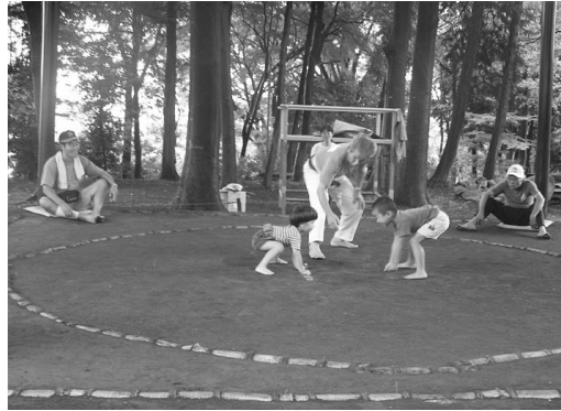
鎮守の森でどろんこすもう (9月25日)