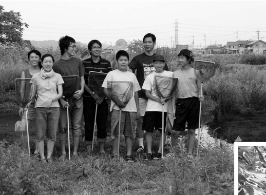
浅川で水遊び (8月22日)